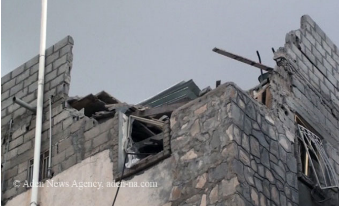
صورة (1): أحد المنازل المهتمة نتيجة للقصف العشوائي

شكك سياسيون وصحفيون ومراقبون بالحملة الامنية والعسكرية التي يقوم بها نظام صنعاء على ما يسمى بتنظيم القاعدة في الجنوب، مؤكدين أن الحرب على القاعدة يحمل طابع سياسي بامتياز، وذلك لإخضاع الجنوب بالقوة لوحدة الدم والموت. وأن