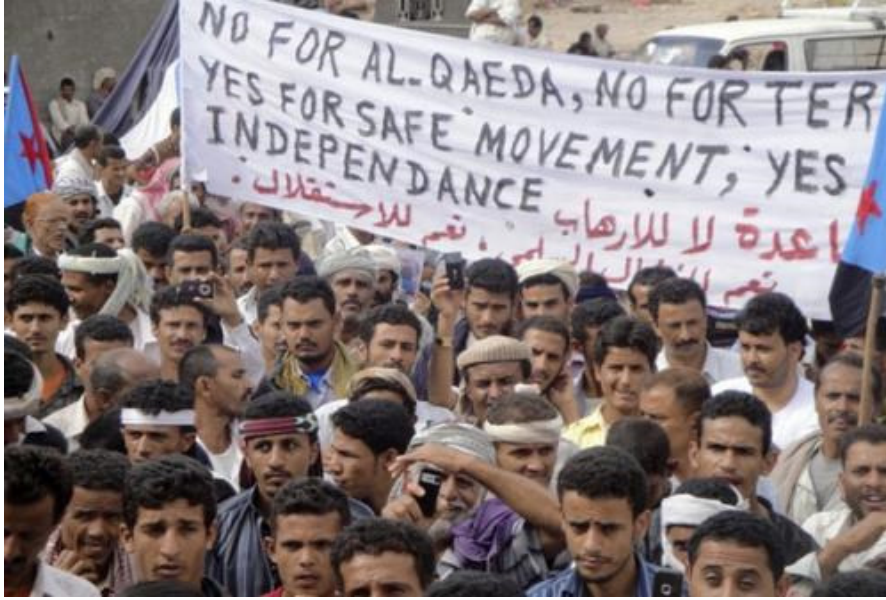
مظاهرة سلمية سابقة للحراك الجنوبي في مدينة عدن

برأت منظمة هيومن رايتس ووتش الحراك السلمي الجنوبي من أي أعمال عنف او مشاركة متظاهرين مسلحين، في تقرير حول أوضاع حقوق الإنسان في الجنوب المحتل بعنوان (باسم الوحدة: رد الحكومة اليمنية القاسي على احتجاجات الحراك الجنوبي)،