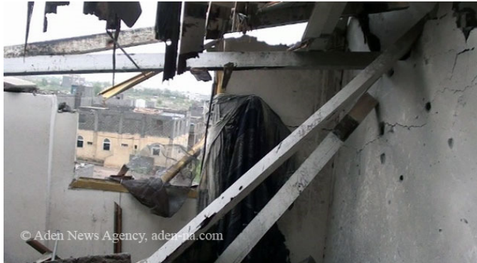
صورة (2): أحد المنازل المهتمة نتيجة للقصف العشوائي

الجنوبي وتنظيم القاعدة، ونفى أن يكون هناك أي علاقة بين الحراك السلمي في الجنوب وبين أنشطة تنظيم القاعدة الإرهابي. وفي نفس الوقت أكد السياسيون والصحفيون والمراقبون أن الحملة الامنية والعسكرية موجهة للخارج لإستدراار الدعم الغربي في محاربة ما يسمى بالارهاب خاصة وتزامن هذه المواجهات مع انعقاد مؤتمرات أصدقاء اليمن في كلاً من لندن والرياض وأبوظبي وبرلين ونيويورك.