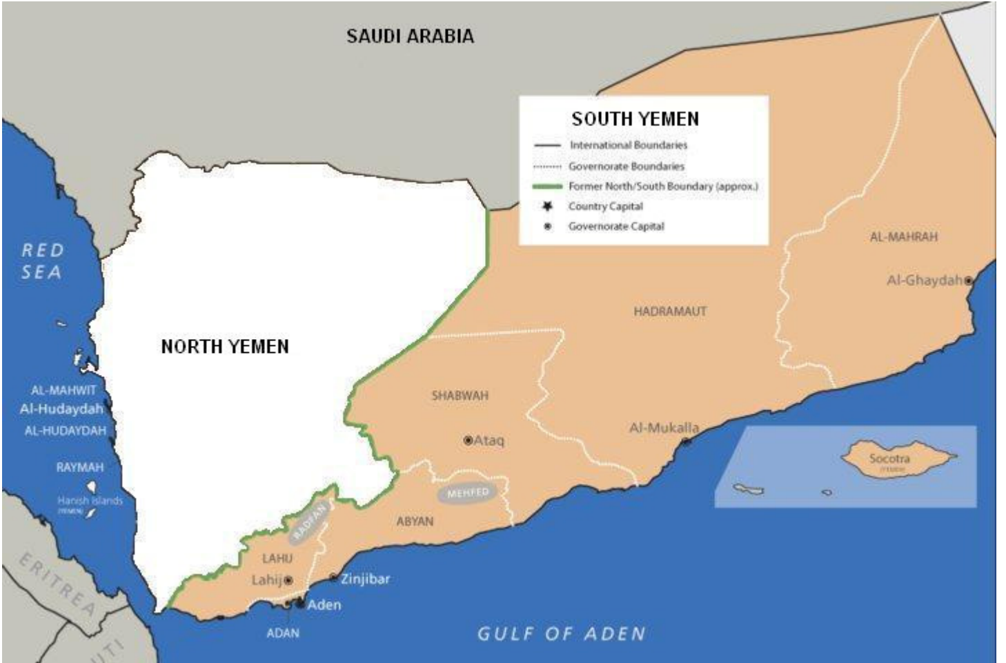
خارطة توضح الحدود السابقة بين الجنوب والشمال